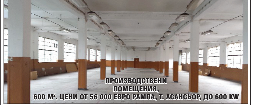
ПРОИЗВОДСТВЕНИ ПОМЕЩЕНИЯ, 600 М², ЦЕНИ ОТ 56 000 ЕВРО РАМПА, Т. АСАНСЬОР, ДО 600 KW