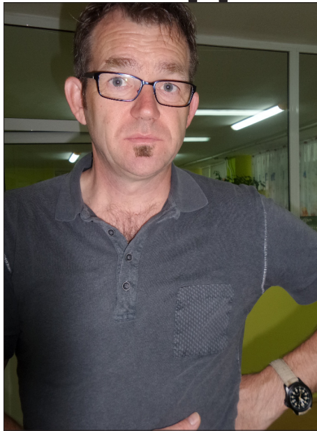
е разликата със ситуацията в Белгия?

- Когато говорим за хора с увреждания, в България смятаме, че основният проблем е градската среда и трудностите им в придвижването. Какви са проблемите на инвалидите, които Ви забелязват у нас и каква