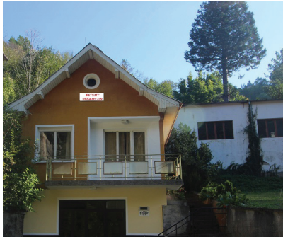
ЕКСКЛУЗИВНА ОФЕРТА РАБОТЕЩ ВЕЩ В РАЙОНА НА ГАБРОВО. 0884119159